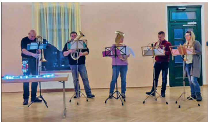
Die Lampertswalder Rentner

Clubvorsitzenden wurden Blumenpräsente überreicht und für ihren langjährigen Einsatz gedankt. Wir danken allen, die zu dieser Feier beigetragen haben und wünschen ein gesundes, gutes und vor allem friedliches Jahr 2024.