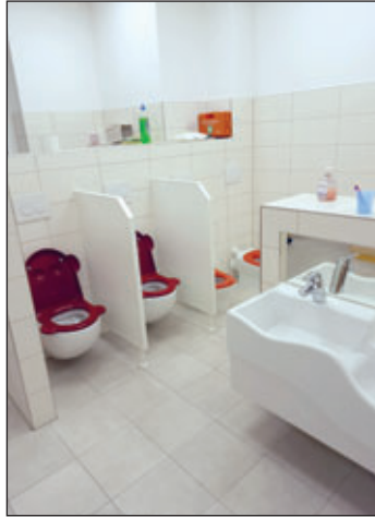
Sanierung eines Waschräume in der Kita „Knirpsenland“