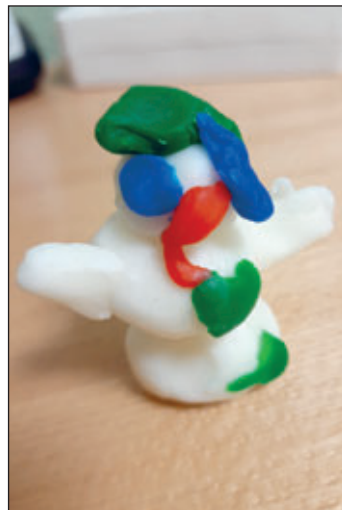
Viele Grüße von den Kindern und dem Team

Die geschmückten „Weihnachtsstuben“ im Knirpsenland sind schon Vergangenheit und winterliche Projekte werden die Kinder noch eine Weile beschäftigen. Es entstehen lustige Schneemannbilder, Vogelhäuser und essbare Schneeflocken. Durch Experimente mit Schnee und Eis lernen die Kinder die Eigenheiten des Winters kennen. Gerade in Vorbereitung ist das Schmücken der Zimmer mit selbst hergestellten Girlanden. Denn: Alle freuen sich schon auf eine tolle Faschingsparty!