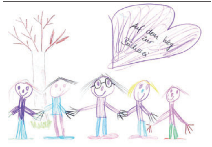
Die Kinder und Erzieher vom Kinderhaus „Am Raschütz“