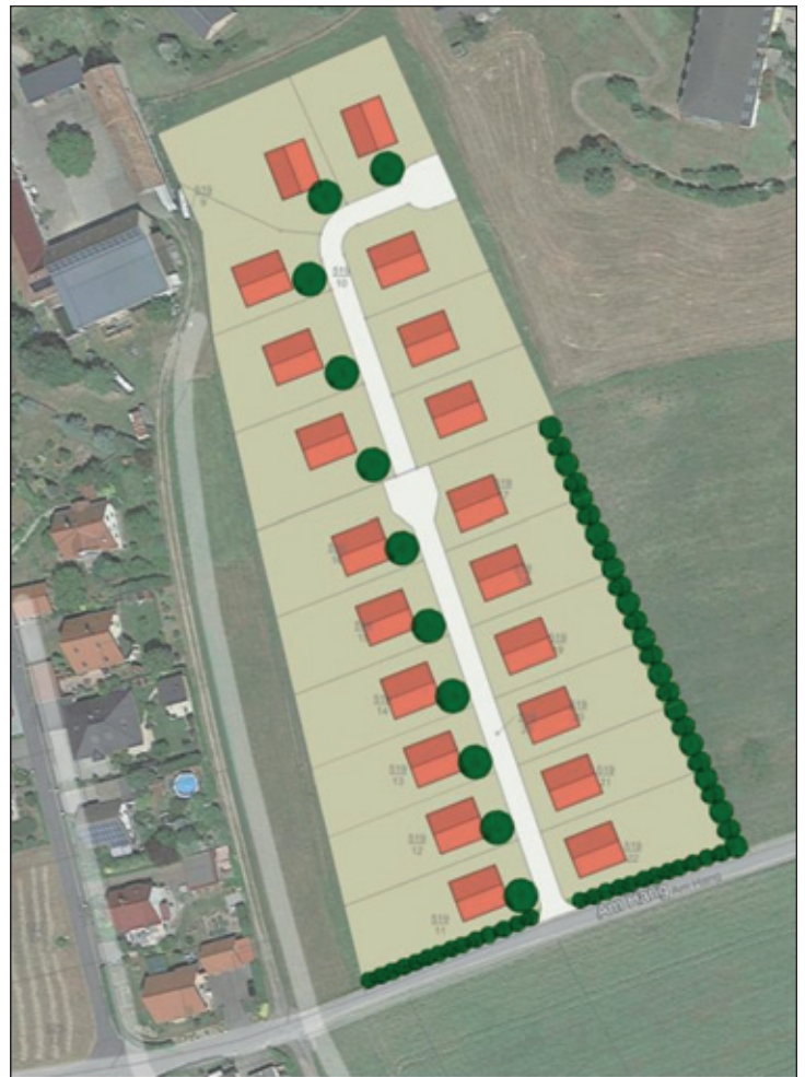
Übersichtsplan Geltungsbereich Bebauungsplan „Wohnbebauung Am Hang II Schönfeld, 2. BA“